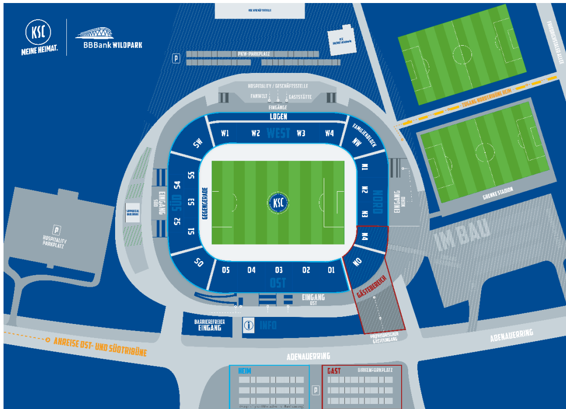
Zugänge Ost-, Süd und Nordtribüne (Heimfans)

Besuchern der Nordtribüne (Blöcke NW, N1 bis N3) empfehlen wir die Anfahrt in die Karlsruher Innenstadt ebenfalls mit öffentlichen Verkehrsmitteln und den anschließenden Fußweg über den Schlossgarten zum Stadionzugang „Germania“.